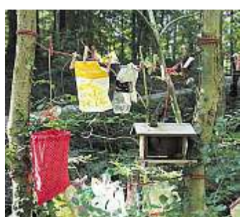
Erfolgreiche Waldputzete. pd

Finissage: Sonntag, 8. 11., 14 bis 16 Uhr, Restaurant Bruderhaus. 15.30 Uhr Spaziergang zum illuminierten «Weissen Hirschen» von Peter Imfeld, mit Geschichten, Trommelwirbel und Lichtzauber.